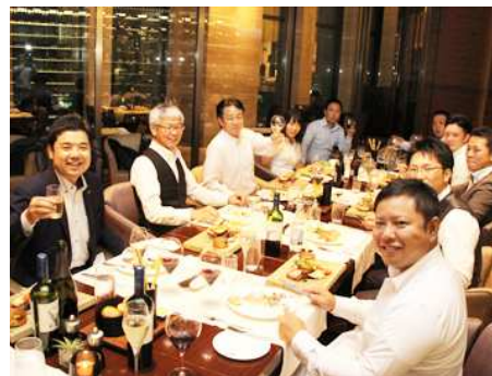
毎月、成績優秀者の豪華食事があります。

褒賞旅行は3ヶ月に1度実施。 1回あたり5名から11名が参加します。 早い社員で入社4ヶ月目に旅行へ参加できるシステムです。 あなたには、ぜひ将来、行き先を決めるような成績優秀者になってください。