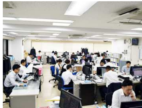
広々としたオフィス環境で、電話営業に集中できます。

経験や年齢は関係ありません。 中途入社の手帳も一切ありません。 意欲と熱意があれば必ず月収608万円が実現します。 課長がしっかりサポートします。