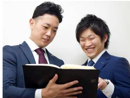
分からないことは、気軽に先輩に聞いてください! 丁寧に教えます。

社歴や年齢に関係なく確実に稼げる環境です。 これまでの人生で手にしたことがないような収入をあなたもつかんでみませんか。