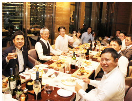
毎月、成績優秀者の豪華食事会があります。

褒賞旅行は3ヶ月に1度実施。 1回あたり5名から11名が参加します。 早い社員で入社4ヶ月目に 旅行へ参加できるシステムです。 あなたには、ぜひ将来、行き先を決めるような 成績優秀者になってください。