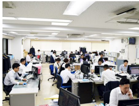
広々としたオフィス環境で、電話営業に集中できます。

経験や年齢は関係ありません。 中途入社の手帳も一切ありません。 意欲と熱意があれば必ず月収608万円が実現します。 課長がしっかりサポートします。