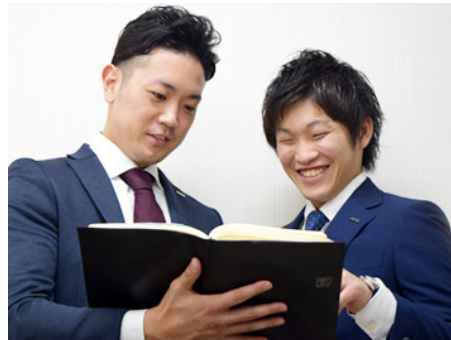
分からないことは、気軽に先輩に聞いてください! 丁寧に教えます。

社歴や年齢に関係なく確実に稼げる環境です。 これまでの人生で手にしたことがないような収入を あなたもつかんでみませんか。