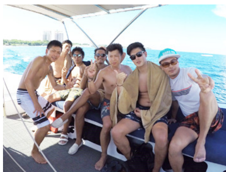
昨年6月に行ってきたセブ島での写真です。年に4回、チャンスがあります。

褒賞旅行が実施されるのは3ヶ月に1度。 入社6ヶ月で参加した社員もいます。 あなたも是非参加してください。 そしてゆくゆくは業績トップの座に輝き、 目的地を決められるような存在になってください。