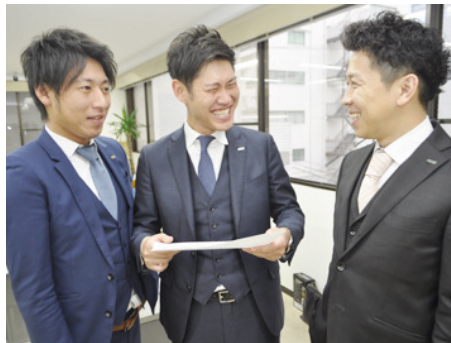
分からないことは、気軽に先輩に聞いてください! 丁寧に教えます。

これは年齢や経験関係なく稼げる証明です。 まさに人生が変わるほどの高収入を NITTOでは手にすることができるのです。 年齢に関係なく稼げることを、あなたも体感してください。