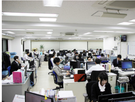
広々としたオフィス環境で、電話営業に集中できます。

課員の給与を除いた全てが課長の給与に反映。 課全体の売上を高めることで更に高収入を目指せます。